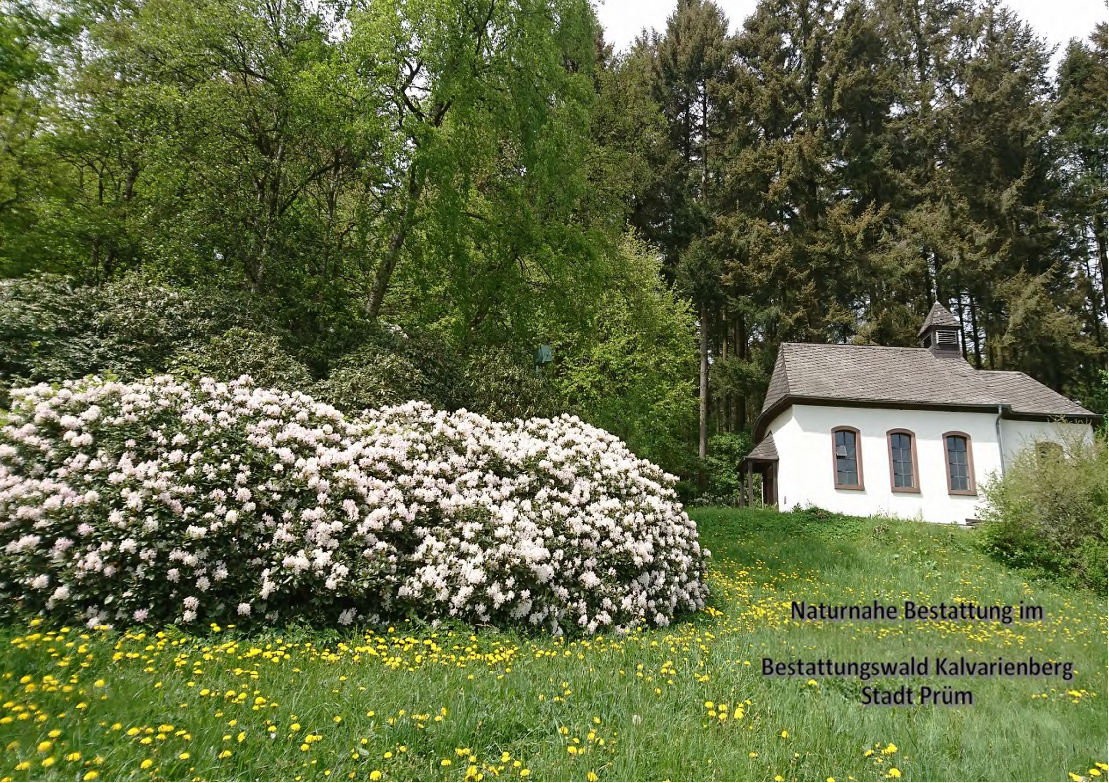
Naturnahe Bestattung im Bestattungswald Kalvarienberg Stadt Prüm